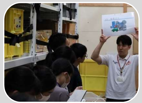
バックヤードツアー