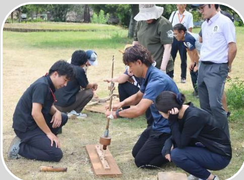
火起こし体験・土器炊飯