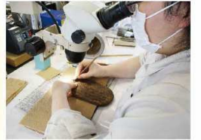
出土品の保存処理事業 (静岡県埋蔵文化財センター提供)