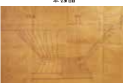
「登呂復元竪穴家屋設計図 (断面図)」 関野克