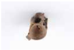
魚類の骨 (登呂遺跡)