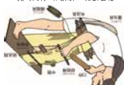
登呂遺跡の織機り (輪状式)

日本で最初に、登呂遺跡で古代(弥生時代)の織機道具が見つかりました。織機の起源は、弥生時代に大陸から稲作などとともに伝わったとされ、出土した遺物を組み合わせ、日本の布づくりの始まりの姿(地機)が復元されました。しかし、その後の研究で別の織機り方法(輪状式織機り)の存在が指摘され、登呂遺跡でも織機り部材の見直しが行われ、織り方法の変更が行われました。登呂遺跡でスタートした海外の民族例との比較も交え、紹介いたします。