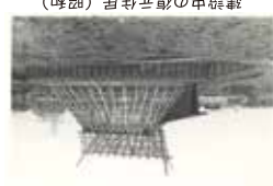
建設中の復元住居 (昭和)

史跡公園や博物館などで復元建物が建てられている光景をよく見かけます。復元建物があることで、見学者は簡単に昔の人々の生活を想像することができるようになりました。遺跡に復元住居を建てる、その最初のようになったのは登呂遺跡です。登呂遺跡では、平成の再発掘後に再整備を行い、発掘成果を基にした復元建物を建てたほか、活用を目指した復元建物もつくっています。本展では、登呂遺跡をはじめとする復元された弥生時代の建物の注目に、復元建物からみえてくる史跡整備を考えます。