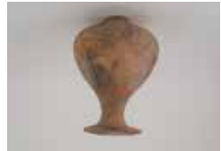
登呂土器 (登呂遺跡)

静岡市では登呂遺跡にみられる登呂ムラで生活が営まれるよりもはるか昔から人々が存在し、暮らしてまいりました。登呂ムラが営まれた時代以前・以後の人々はどこでどのような暮らしをしていたのでしょうか。この展示では、登呂ムラが営まれていた弥生時代の原始だけでなく、縄文時代や古墳時代など静岡市域の原始から古代に注目します。地面の中から見つかった当時の道具や骨などの自然遺物を紹介し、遺跡や道具などからみるここのてできる人々の暮らしや静岡市の景観をご紹介します。