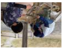
屋外 体験イベント (通年実施)