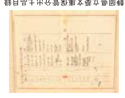
静岡県立歴史民俗資料館分出土品目録 (第1次調査)

昭和100年を迎える2026年を記念し、本展では昭和18年(1943)および22-25年(1947-1950)に実施された登呂遺跡第1〜5次調査の出土遺物と発掘記録を通して、戦前から戦後にかけての日本社会の「あけぼの」を振り返ります。激動の時代に行われたこれらの発掘調査は、考古学研究のみならず、日本社会の歴史認識にも大きな影響を与えました。本展では、調査成果や当時の様子をあらためて紹介するとともに、昨年度実施した発掘調査記録等のデジタルアーカイブ化事業の成果も紹介します。