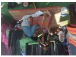
輪状式織機り (ハトム)