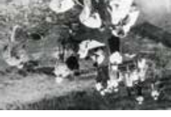
S22年第2次調査 発掘開始の日