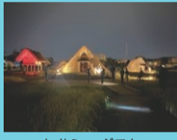
ナイトミュージアム