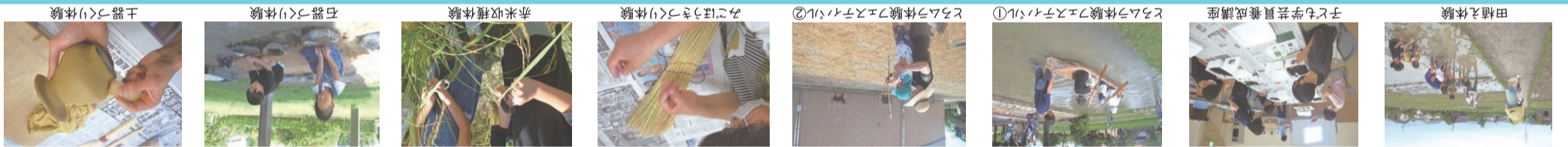
体験・イベントの様子