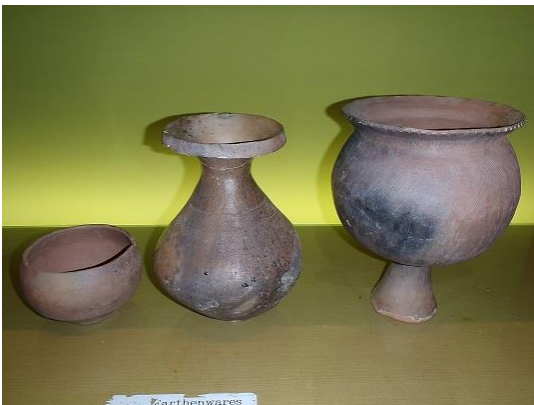
弥生土器レプリカ (右から甕、壺、碗)