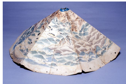
富士山立体絵図 富士山かくや姫ミュージアム蔵