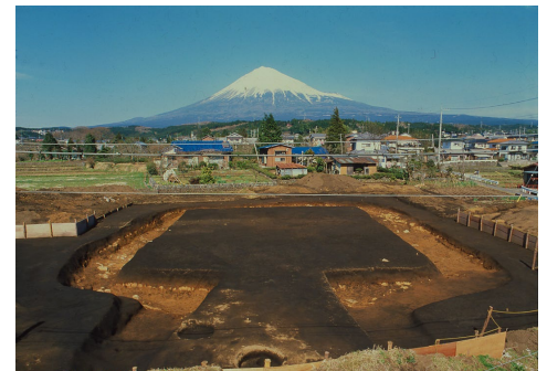
丸ヶ谷遺跡発掘状況