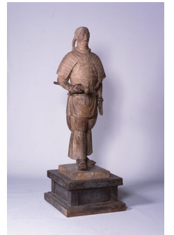
中村直人「草薙剣」 登呂博物館蔵