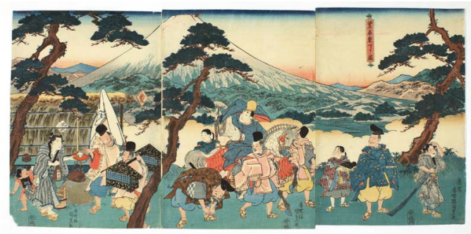
歌川国貞「業平東下りノ図」江戸中期 静岡市教育委員会蔵

世界遺産、富士山。私たちは富士山が大好きです。ときに美しさを感じるもの、ときに敬うべきもの、そして、ときに畏れるものとして、古来から富士山は人々を魅了してやまないものでした。そんな富士山を登呂遺跡に住んでいた人も見ていました。そして、私たちも富士山を見ています。過去から現在まで、日本人はどのように富士山に向き合ってきたのでしょうか。本展示では、「信仰」、「芸術」だけでなく、「考古」的な側面を含め富士山を見ていきます。